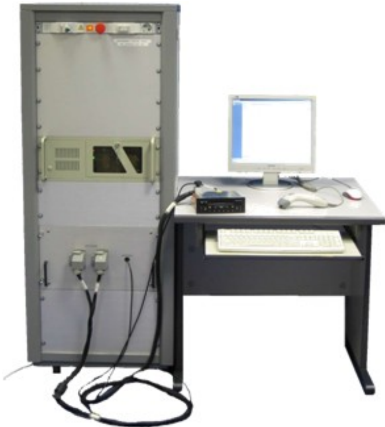
Banc de test d'autoradio

Ce banc de test est destiné à la validation des mesures électroniques de l'autoradio et principalement la qualité audio. Le système doit être assez souple pour gérer plusieurs modèles d'autoradio (K7 ou CD) mais également plusieurs versions.